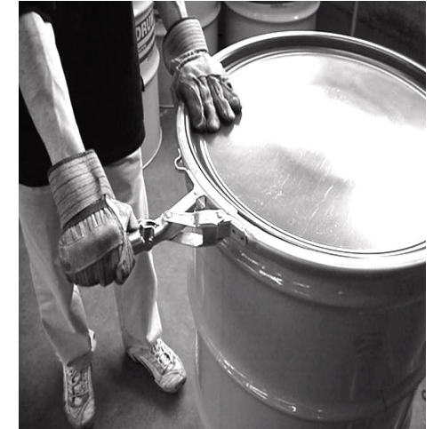
Figure 8 – Palanca deberá cerrarse lentamente