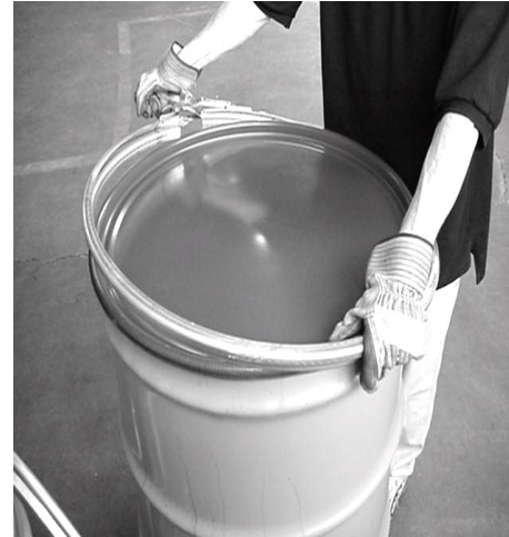
Figure 7 – Abra el anillo para ser instalado